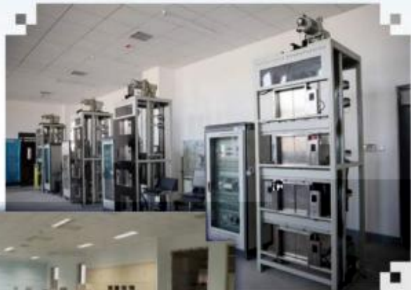
智能电梯安装调试 维护训练场所